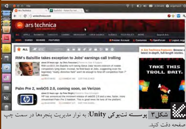
شکل ۳ پوسته نت بوکی Unity: به نوار مدیریت پنجره ها در سمت چپ صفحه دقت کنید.

است، اما کاربر به یقین متوجه بهبودها و تغییرات صورت گرفته خواهد شد.