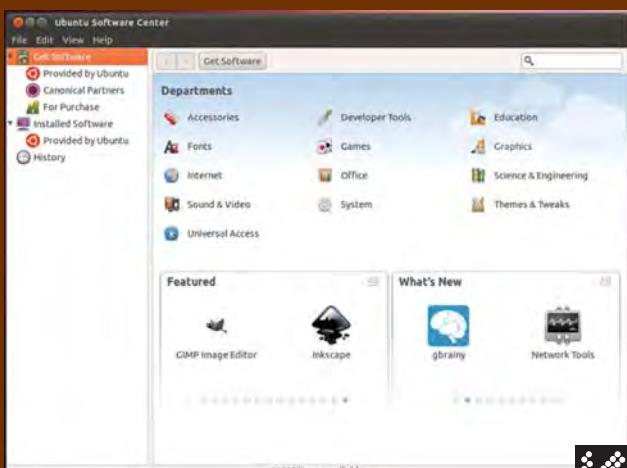
شکل ۲ مرکز نرم افزار اوپننتو: به کادرهای پایین پنجره نرم افزار توجه کنید. کادر سمت راست آخرین به روزسانی ها و کادر سمت راست، نرم افزارهای طرفدار را نمایش می دهد.