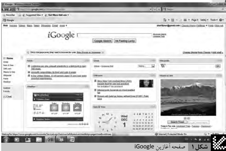
شکل ۱ صفحه آغازین iGoogle