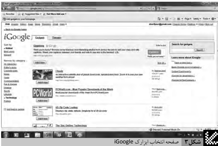
شکل ۳ صفحه انتخاب ابزار iGoogle