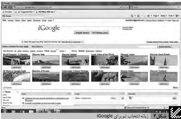
شکل ۲ زبانه انتخاب تم برای iGoogle

پس از افزودن تمام ابزارهای موردنظر در پایین سمت چپ صفحه روی لینک Back to iGoogle home کلیک کنید تا به صفحه خانگی خود برگردید. اگر جز افرادی هستید که دستکتاب شلوغی دارند یا به استفاده از ابزارهای متعدد عادت دارید، به احتمال یک صفحه، گنجایش تمام ابزارهای موردنیاز شما را نخواهد داشت. در این صورت می‌توانید مانند شکل ۴ از دکمه تنظیمات در کنار Home برای افزودن یک یا هر تعداد دلخواه Tab یا زبانه جدید به iGoogle استفاده کنید و ابزارهای خود را در این زبانه‌ها دسته‌بندی کنید یا با دوستانتان به اشتراک بگذارید.