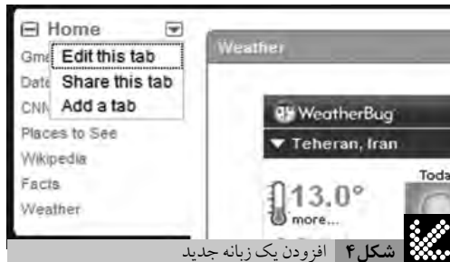
شکل ۴ افزودن یک زبانه جدید