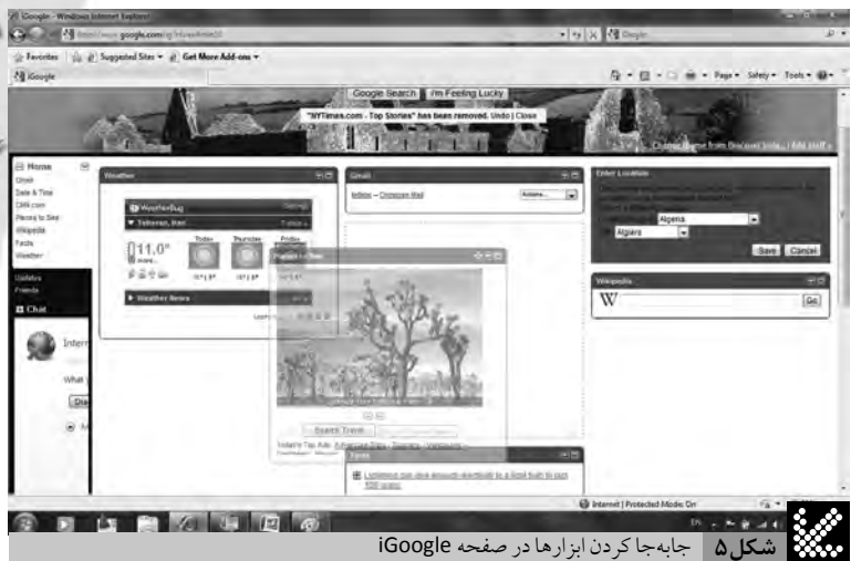
شکل ۵ جابه‌جا کردن ابزارها در صفحه iGoogle