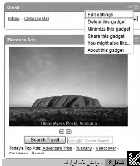
شکل ۶ ویرایش یک ابزارک